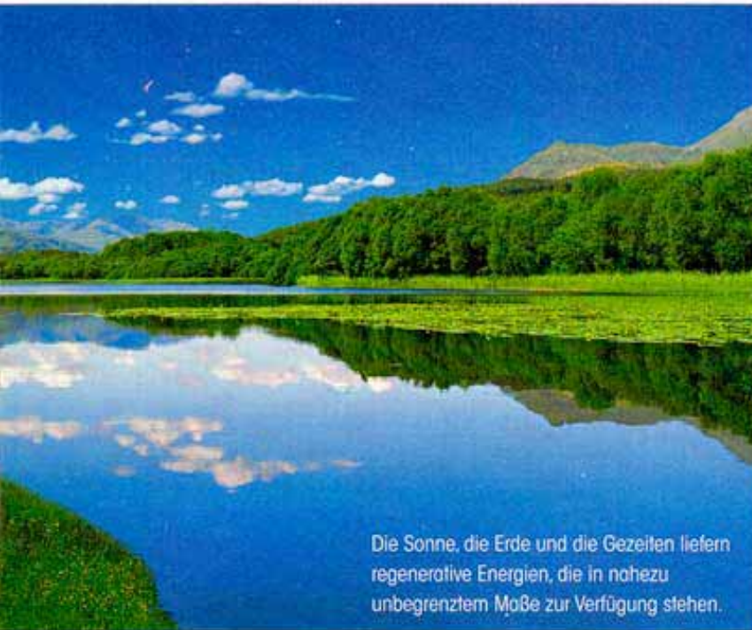
Die Sonne, die Erde und die Gezeiten liefern regenerative Energien, die in nahezu unbegrenztem Maße zur Verfügung stehen.